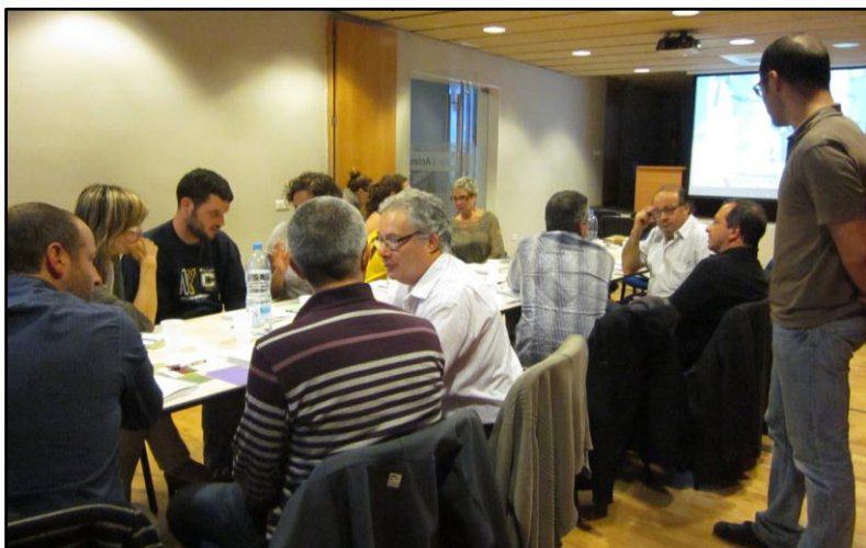
Foto 4. Moment de reflexió i debat en grups.

Es va presentar al Grup de Debat una fotografia aèria del municipi l'any 1984 i també es va exposar la fotografia vigent (2012). L'exercici consistia en que els grups reflexionessin sobre a) com creuen que serà i b) com els agradaria que fos una hipotètica fotografia de l'any 2040, aproximadament. Com serien els canvis? En positiu o en negatiu? Quin pes tindria l'agricultura l'any 2040?