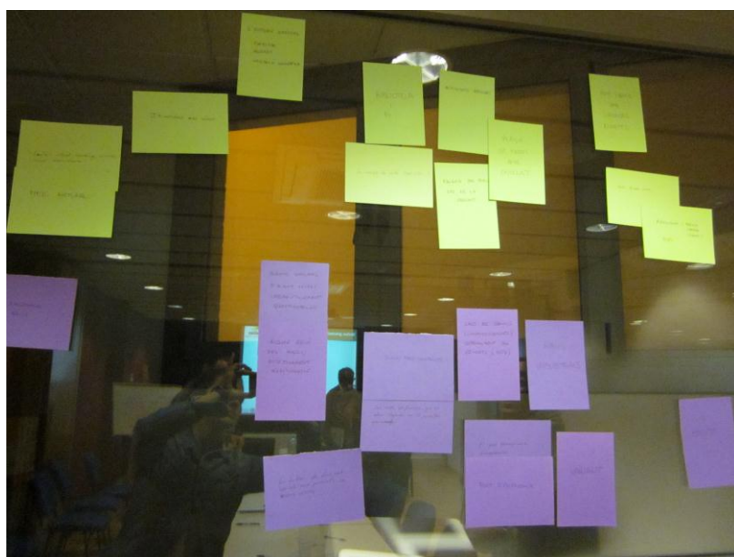
Foto 3. Les aportacions dels grups per a l'exercici "un spot publicitari per al paisatge de Torrelles" es van agrupar segons si feien referència al paisatge agrícola, natural o urbà.

Els grups van anar exposant aquestes aportacions a la resta del Grup de Debat sobre el Paisatge, i es van anar agrupant segons si feien referència al paisatge agrícola, natural o urbà.