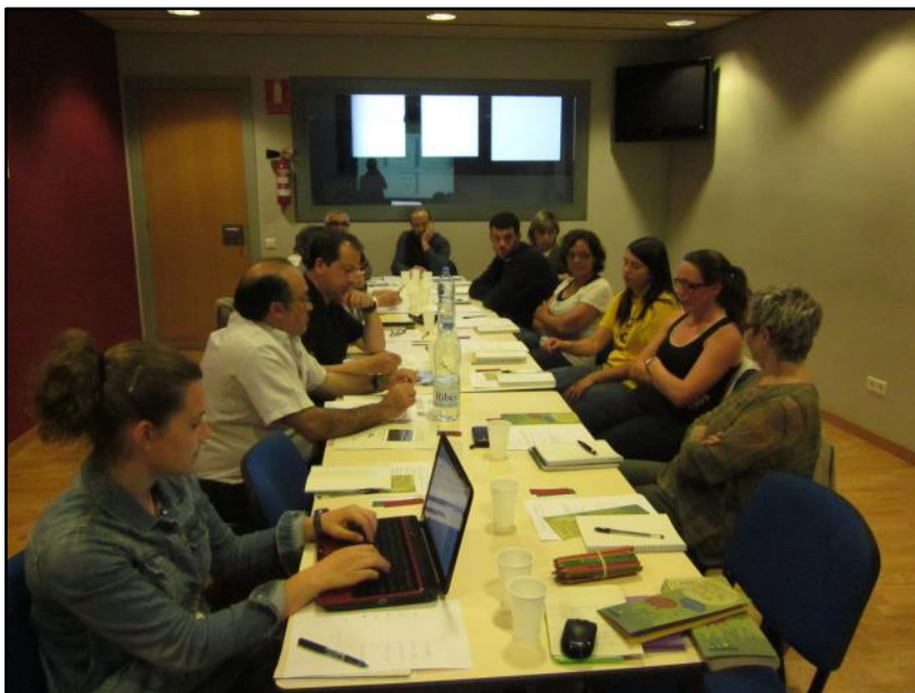
Foto 1. Per iniciar la dinàmica de treball, els participants del grup es van presentar breument.

Els participants es van presentar: nom, lloc on viuen i què entenen ells per "paisatge" (en una paraula). Hi va haver participants que es van incorporar més tard a la sessió i que no van realitzar aquesta activitat.