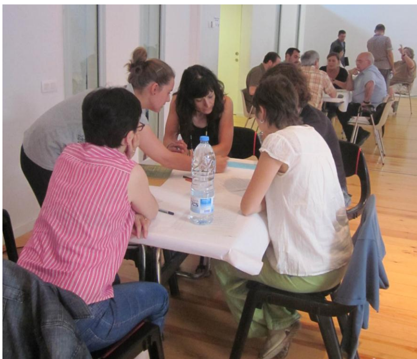
Foto 1. Els assistents es van distribuir en sis grups, un per a cada objectiu de paisatge.

Els participants havien de formular propostes per a cada objectiu amb una dinàmica rotatòria tipus "World Café", és a dir, varen poder "visitar" les tres taules que fossin del seu major interès. A cada una de les taules, hi podien dedicar 20 minuts en fer propostes concretes d'actuació.