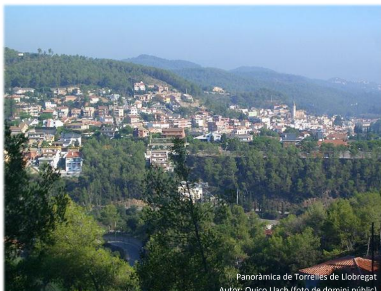
Panoràmica de Torrelles de Llobregat Autor: Quico Llach (foto de domini públic)