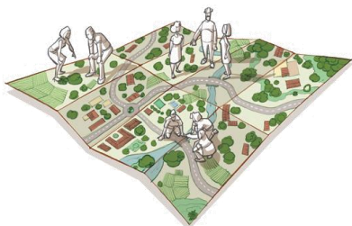
Dibuix: Miguel Herranz, a Busquets, J (2011). La sensibilizació en paisatge

Els propers passos en el procés participatiu de "Cesalpina millora amb tu" tindran a veure amb el disseny del nou parc de Cesalpina :